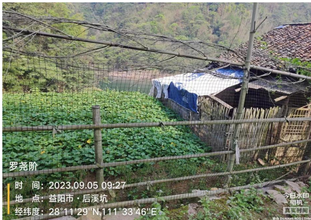
(罗尧阶田地，还田消纳)