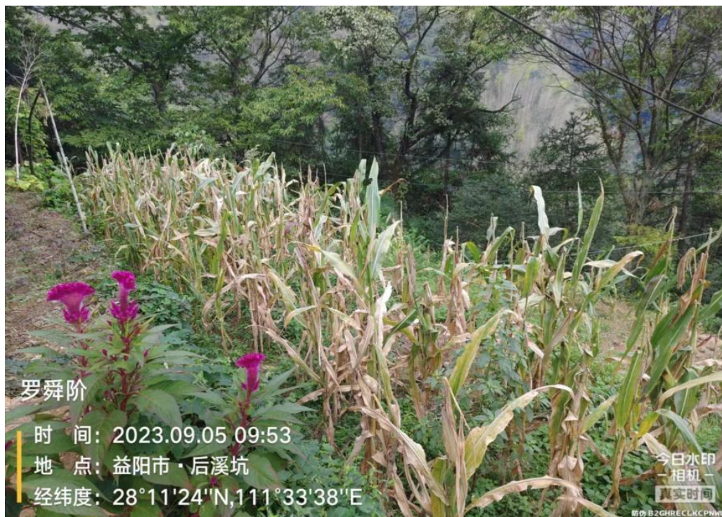
(罗舜阶田地，还田消纳)