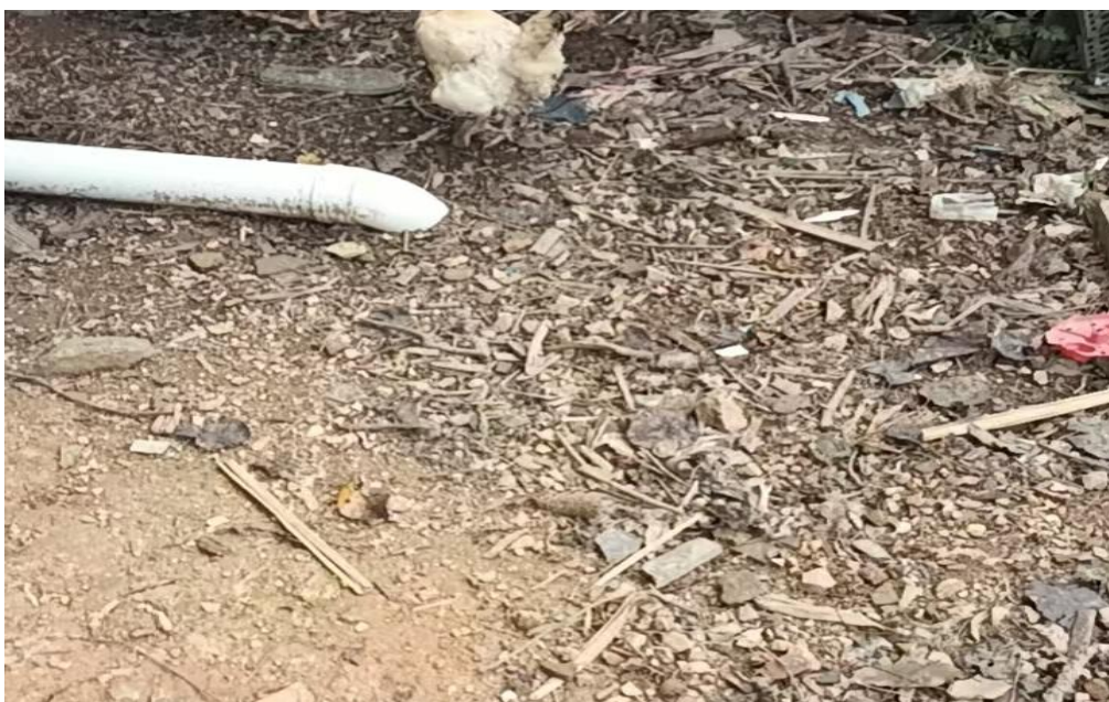
(李协中化粪池埋地)