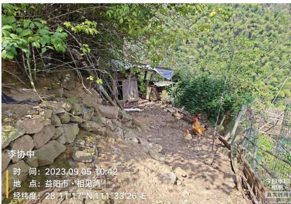
(李协中田中搜集池)